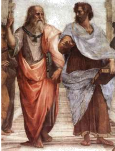
Escuela de Atenas (Rafael)