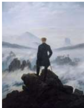
El caminante sobre el mar de nubes (Caspar David Friedrich)

EN RESUMEN: Tienes la oportunidad de pensar por ti mismo/a. Pero el pensar por uno/a mismo/a no es decir una ocurrencia, sino hacerlo teniendo en cuenta tus conocimientos y usando tus capacidades. El tipo de reflexión que se te pide tiene que ver con “pensar” el problema del texto u otro aspecto de la filosofía del autor, en su contexto o en otro contexto (actual o no) que tú decides.