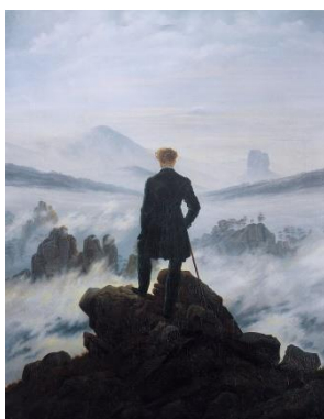
El caminante sobre el mar de nubes (Caspar David Friedrich)

EN RESUMEN: Tienes la oportunidad de pensar por ti mismo. Pero el pensar por uno mismo no es decir una ocurrencia sino hacerlo teniendo en cuenta tus conocimientos y usando tus capacidades. El tipo de reflexión que se te pide tiene que ver con “pensar” el problema del texto, en su contexto o en otro contexto (actual o no) que tú decides.