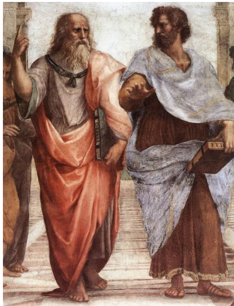
Escuela de Atenas (Rafael)

EN RESUMEN: Explica lo que dice el autor y cómo lo dice y para ello usa tus conocimientos sobre su filosofía. Si para explicarte bien necesitas citar otros autores, adelante, si no lo consideras oportuno, bien también.