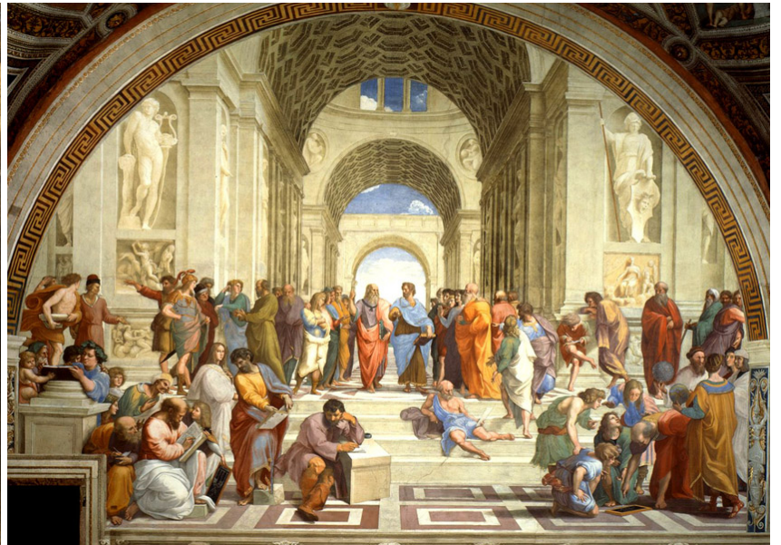
Lámina 2 (B)