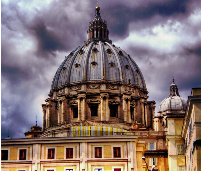
Lámina 1 (A)