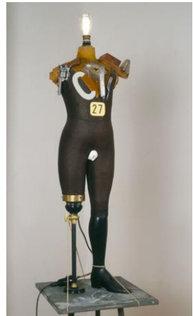
Raoul Hausmann y Georges Grosz. Escultura reconstruida: El pequeño burgués Heartfield enloquecido, o Tatlin. Escultura electromecánica (1920).