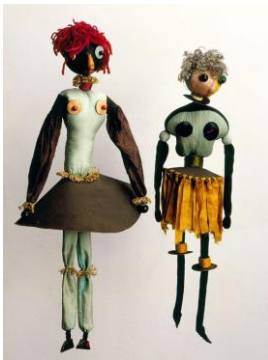
Hanna Höch. Escultura-Marionetas: Marionetas Dadá (1920).