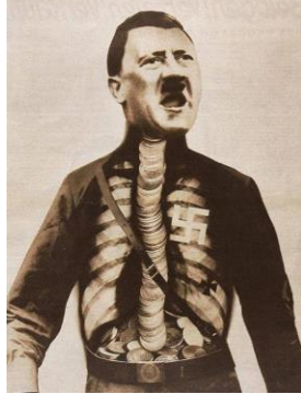
John Heartfield. Fotomontaje para el periódico AIZ: Adolf como Superhombre (1932).