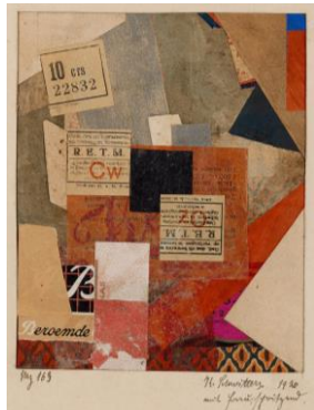
Kurt Schwitters. Collage y tipografía: Collage Merz (Mz 163 mit Frau, spritzend) (1920).