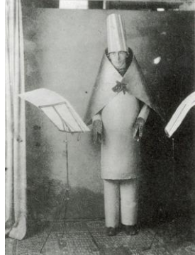
Hugo Ball. Documento fotográfico de una actuación en el Cabaret Voltaire: Karawane (poema fonético) (1916).