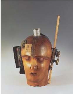
Raoul Hausmann. Escultura: El espíritu de nuestro tiempo (Cabeza mecánica) (1919).

BLOQUE 2. PREGUNTA COMPETENCIAL. Asumiendo la tarea de jefe de colecciones del MNCARS, se te pide reorganizar una nueva sala de la colección permanente dedicada al movimiento de las vanguardias de entreguerras Dadá . De entre las siguientes imágenes debes seleccionar cinco y elaborar un discurso expositivo, es decir, un hilo argumental o narrativo que justifique la selección. Puede estar basado en el contexto histórico de las imágenes, en las relaciones formales entre las obras, en los materiales o técnicas artísticas empleados por los artistas, en la simbología, la dimensión política de las imágenes, etc. El discurso debe constar de un título creativo y una introducción para un catálogo. La extensión aproximada de la introducción será de 450-600 palabras. Además de citarlas en el texto, no olvides marcar con una cruz sobre los pies de foto las imágenes seleccionadas (2,5 puntos máximo).