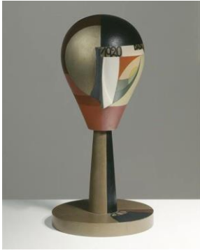
Sophie Taeuber-Arp. Escultura: Cabeza Cadá (1920).