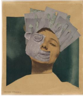
Hanna Höch. Collage-Fotomontaje: Bailarina india de un museo etnográfico (1930).