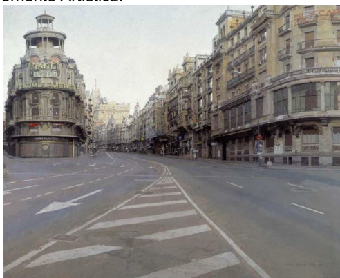
7 Autor: Título: Corriente Artística: