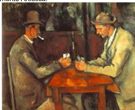
3 Autor: Título: Corriente Artística: