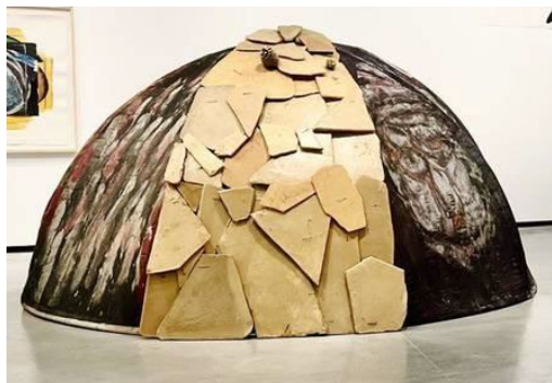
1 Autor: Título: Corriente Artística:

Relaciona las siguientes imágenes con su autor, título y corriente artística.