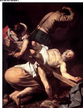
4 Autor: Título: Corriente Artística: