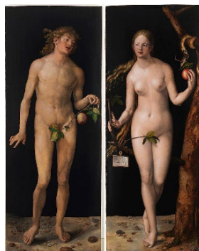
2 Autor: Título: Corriente Artística: