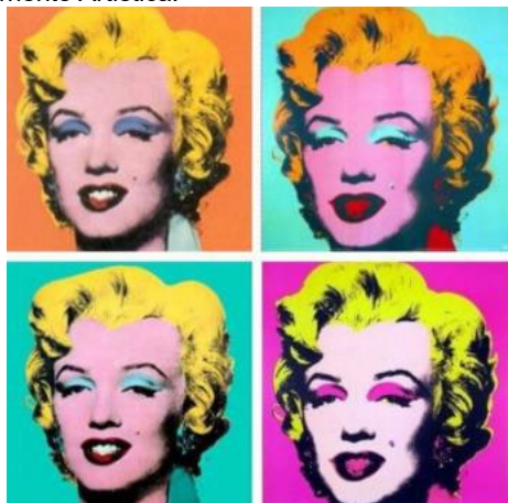
5 Autor: Título: Corriente Artística: